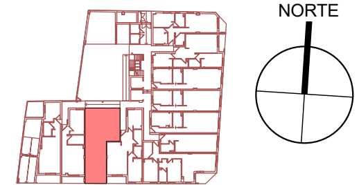
VIVIENDA I - PLANTA BAJA