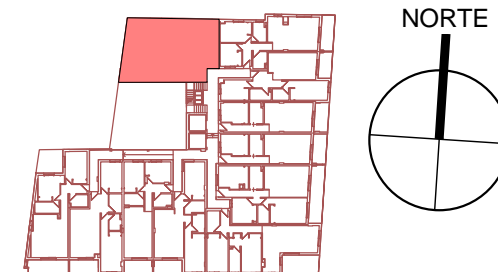
VIVIENDA A - PLANTA PRIMERA