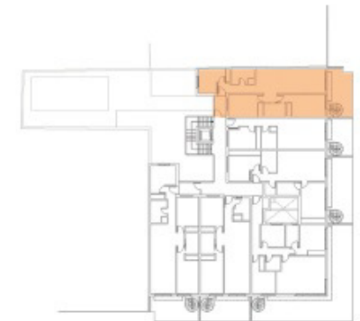
Planta Segunda Vivienda A